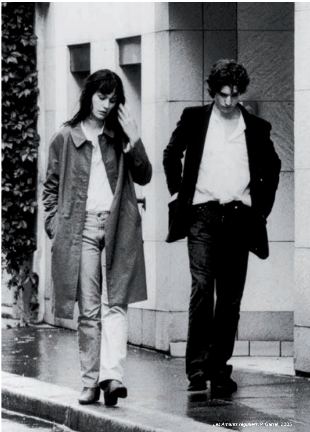
Les Amants réguliers, P. Garrel, 2005