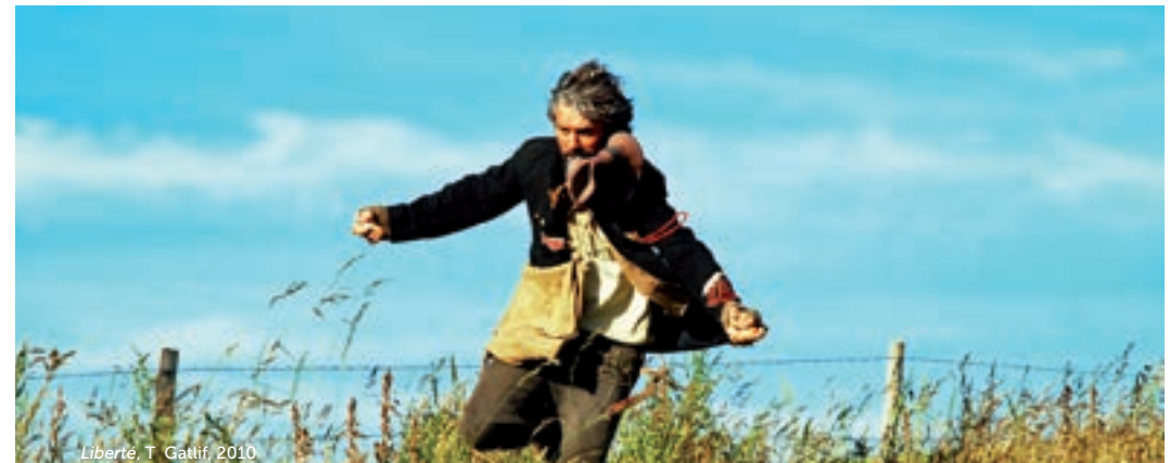
Liberté, T. Gatlif, 2010