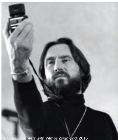
Close Encounters with Vilmos Zsigmond, 2016