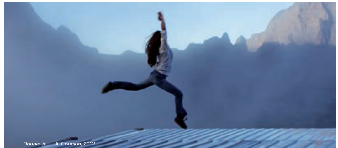
Double-je, L.-A. Courson, 2012