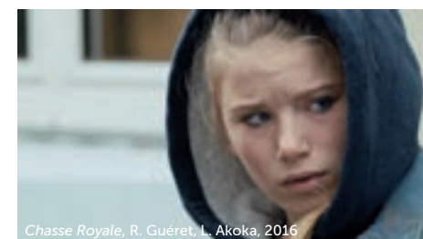
Chasse Royale, R. Guéret, L. Akoka, 2016