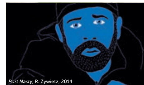
Port Nasty, R. Zywiets, 2014