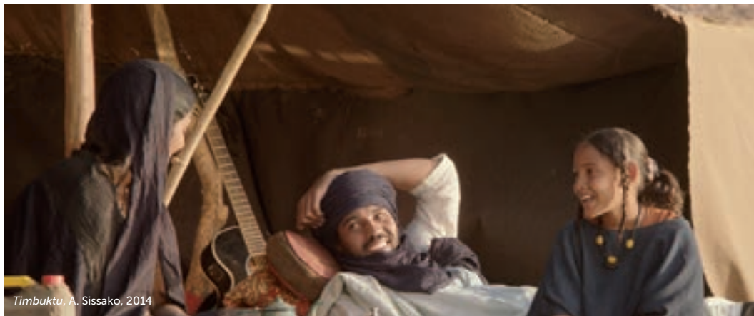
Timbuktu, A. Sissako, 2014