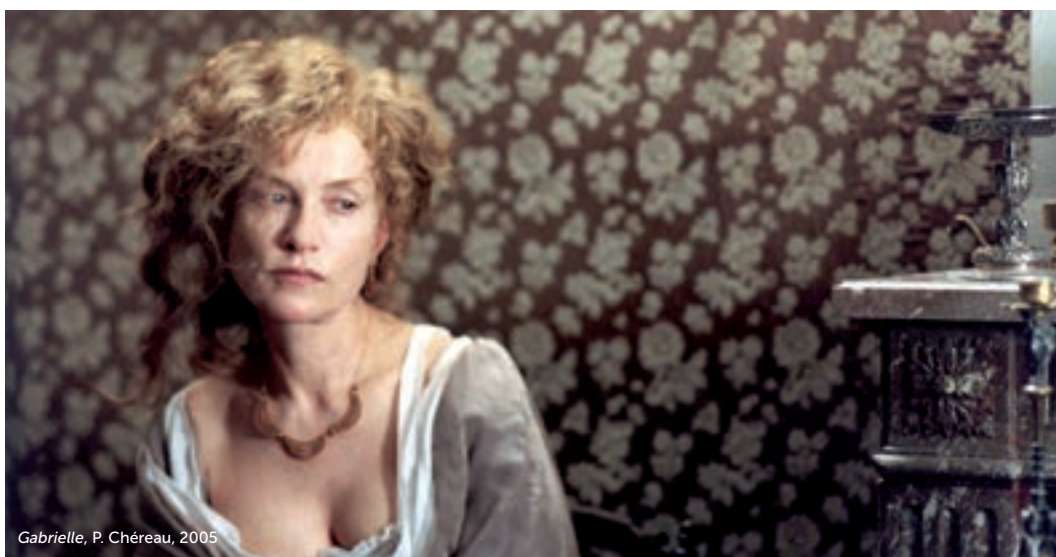
Gabrielle, P. Chéreau, 2005