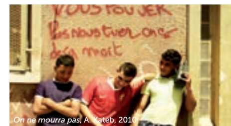
On ne mourra pas, A. Kateb, 2010