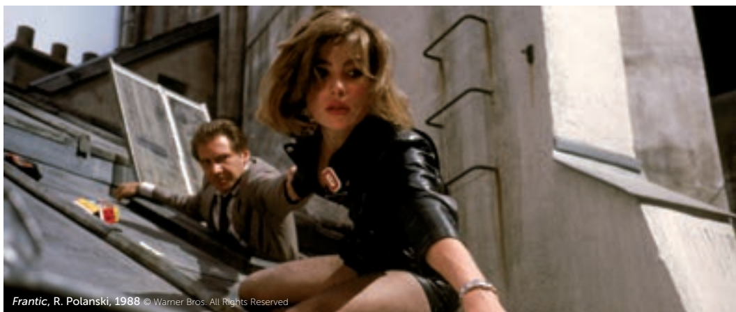
Frantic, R. Polanski, 1988