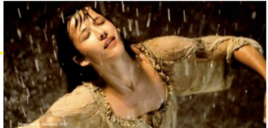
Marquise, V. Belmont, 1997

17 SÉANCES, DONT 2 SÉANCES SCOLAIRES 25 FILMS, DONT DES COURTS !